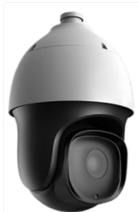
Комплекс автоматического мониторинга SOVA

Решение обеспечивает интеллектуальный мониторинг улично-дорожной сети, позволяет повысить эффективность: управления парковочным пространством города, в т.ч. платными парковками; деятельности по выявлению и предупреждению нарушений ПДД в части стоянки и остановки автомобилей; наблюдения за состоянием дорожных знаков, уборкой и содержанием улиц, состоянием других объектов дорожной инфраструктуры.