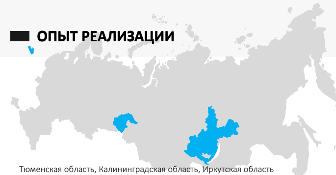
Тюменская область, Калининградская область, Иркутская область