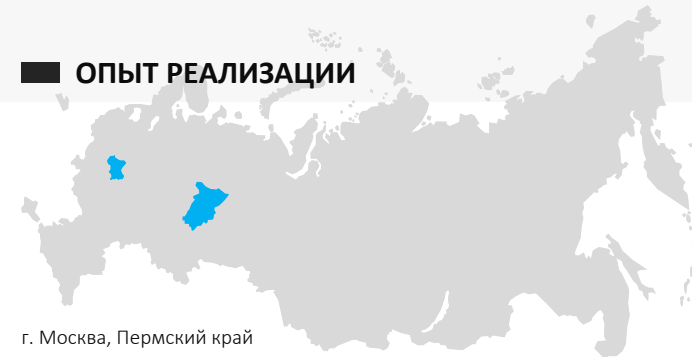
г. Москва, Пермский край